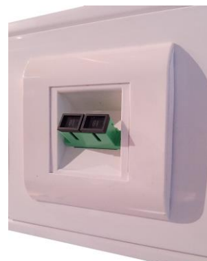
Gniazdo SC Duplex, w osprzęcie mosaic (45x45) i z pokrywą kanału PM130-1/BI

Kanały podparapetowe Emitter umożliwiają stworzenie abonenckiego punktu światłowodowego, tzw. fiber-to-the-desk. Aby prawidłowo zabezpieczyć tor światłowodowy w kanałach, istotne jest dobranie rozmiaru kanału, aby w środku zamontować cały niezbędny osprzęt, a więc: kasetę światłowodową z osłonkami spawów, ramkę montażową, adapter, a także zorganizować zapas kabla światłowodowego. Należy także zachować promień gięcia dla wprowadzanego pigtaila lub patchcordu, przez zapewnienie odpowiedniej głębokości kanału. Emitter dostarcza kompleksowe rozwiązania w pełnym zakresie niezbędnych produktów, aby w kanale podparapetowym stworzyć gniazdo światłowodowe.