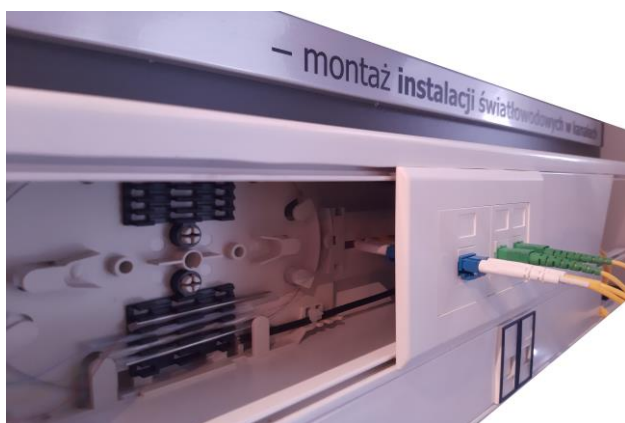
Gniazda LC duplex, SC simplex oraz UTP, zabudowane w kanale 150x60