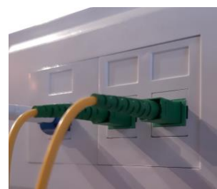
Gniazda LC duplex oraz SC Simplex, w osprzęcie mosaic (45x45), zamontowane bezpośrednio na brzegu kanału