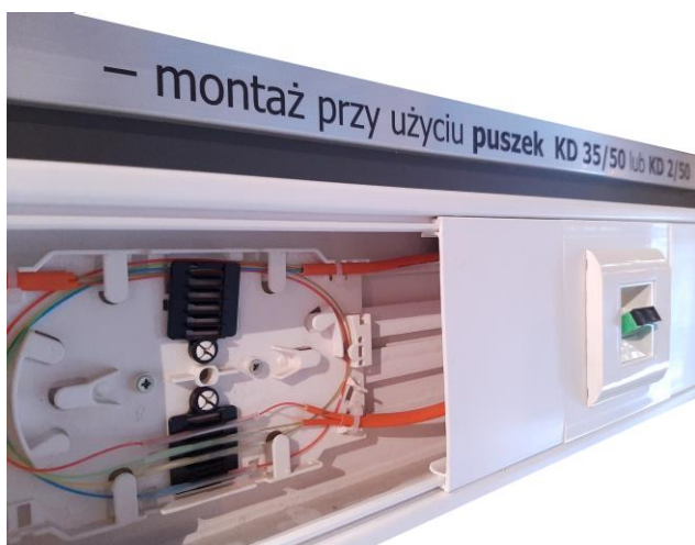
Gniazdo SC duplex, zabudowane w kanale 130x60

UWAGA: Spytaj również o inny asortyment światłowodowy. W ofercie Emiter dostępne również: