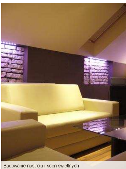
Budowanie nastroju i scen świetlnych