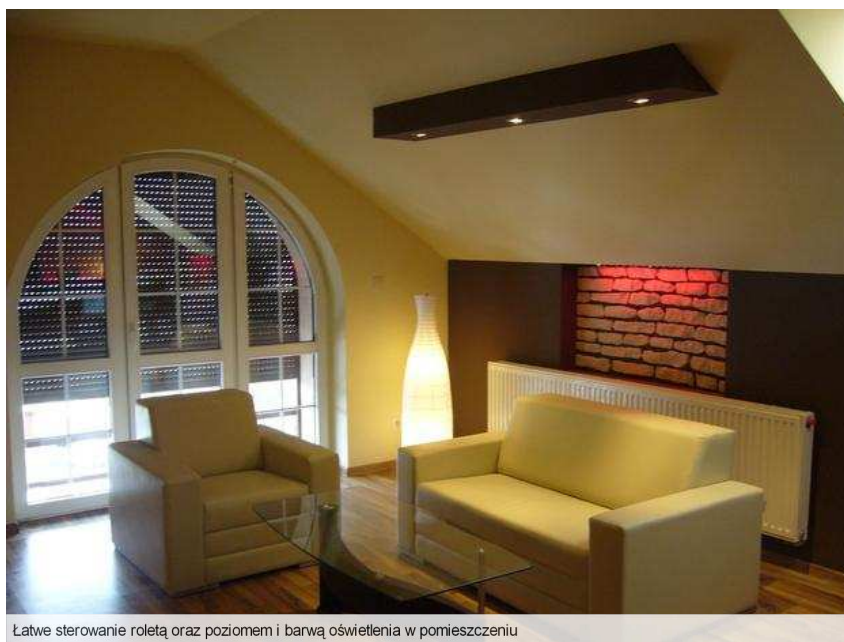
Łatwe sterowanie roletą oraz poziomem i barwą oświetlenia w pomieszczeniu

Korzystając z tej samej sieci można łatwo tworzyć dowolne konfiguracje. System sterowania jest otwarty, to znaczy daje się dowolnie rozbudowywać bez zmiany instalacji, na przykład, aby zmienić funkcję wyłącznika, by zamiast światłem mógł sterować opuszczaniem rolet okiennej, nie trzeba kuć ścian i kłaść kolejnych kabli. Wystarczy odpowiednio przeprogramować instalację. Inny przykład: dotychczasowa inteligentna instalacja domowa sterowana jest przez ekrany dotykowe, ale planowane jest sterowanie nią przez internet. Można w każdej chwili dokupić uzupełniające urządzenia i po stworzeniu wizualizacji zarządzania domem, uruchomić ją bez ingerencji w dotychczasową instalację.