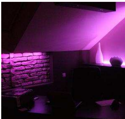
Barwne światło dzięki diodom LED RGB

W podrzeszowskim Miłocinie powstał "inteligentny" dom dla osób zainteresowanych działaniem nowoczesnej, w pełni zautomatyzowanej instalacji. Udostępniono w nim pokazowe mieszkanie, w którym każdy może się zapoznać z systemem automatyki domowej Teletask, poznać w praktyce jego działanie i możliwości.