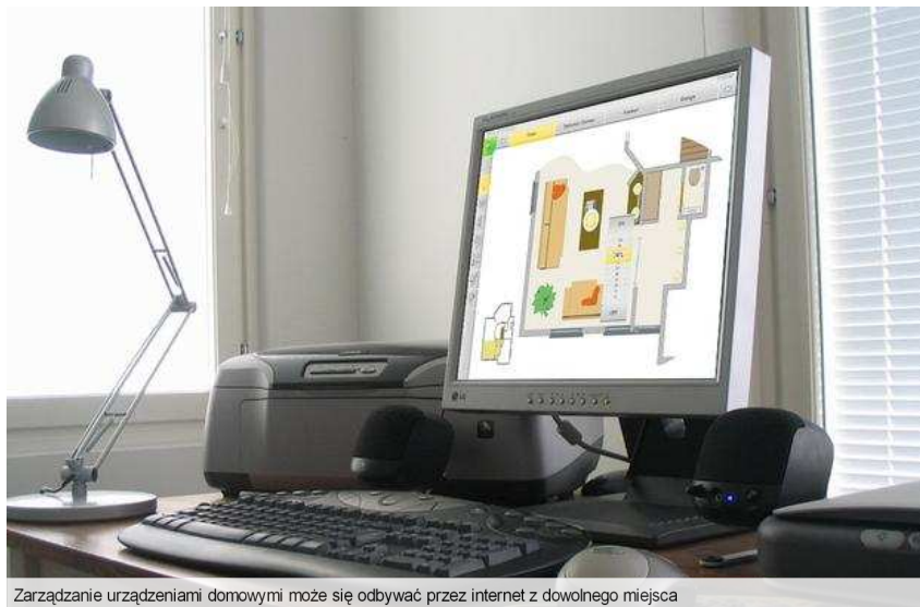
Zarządzanie urządzeniami domowymi może się odbywać przez internet z dowolnego miejsca

Zarządzanie i kontrola domu przez internet stają się dziś rozwiązaniami standardowymi. Każda funkcja systemu może zostać w bezpieczny sposób określona i zmieniona zdalnie. W domu działa sieć bezprzewodowa Wi-Fi, która spięta jest z centralą Micros systemu Teletask, dzięki czemu uzyskuje się sterowanie za pomocą internetu. Do tego stworzona została wizualizacja domu z naniesionymi pomieszczeniami, meblami i sterowanymi urządzeniami, która uruchomiona na komputerze pozwala nam na graficzne zarządzanie mieszkaniem. Gdy za oknem ładna, słoneczna pogoda, siedząc w pracy możemy przez internet otworzyć okno i przewietrzyć mieszkanie albo gdy wychodząc z domu zapomnieliśmy włączyć alarm, możemy to zrobić z komputera w pracy. Bez trudu można też sprawdzić, czy któryś z domowników jest aktualnie w domu lub zobaczyć obraz z kamer IP.