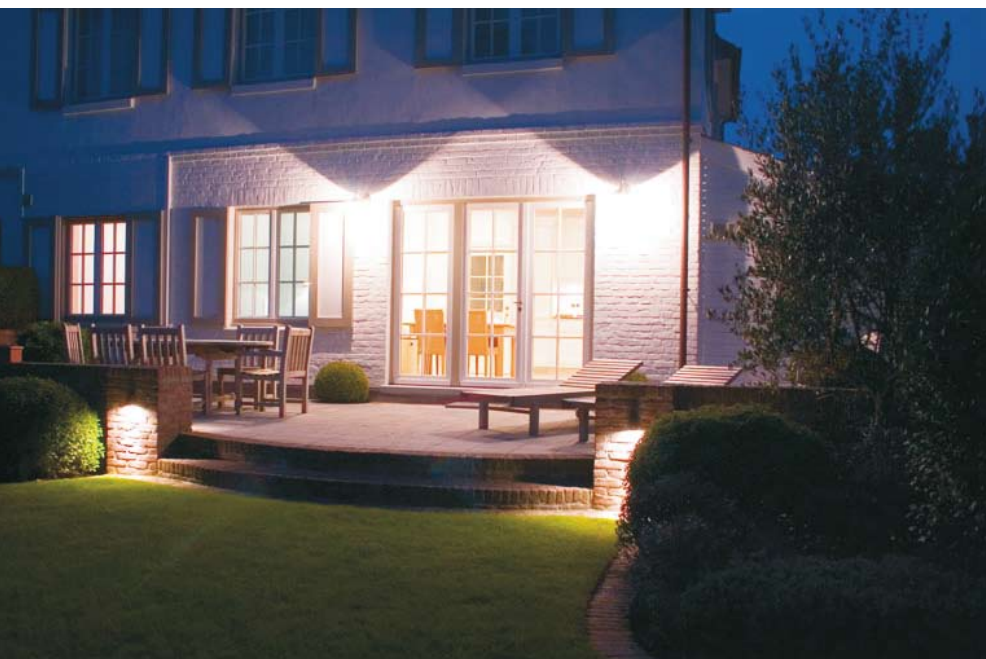
Rys. 1. Przykładowy inteligentny dom

Przedsiębiorstwo Emitter jako producent kanałów kablowych i systemu okablowania strukturalnego wykonuje kolejny krok ku integracji instalacji elektrycznych, wprowadzając do oferty pełne systemy automatyki domowej (domotyki): Teletask - systemem magistralny, dedykowany do domów, budynków biurowych i ekskluzywnych apartamentów oraz Teleco - system bezprzewodowy, proponowany do małych i średnich instalacji, które mają zapewnić wygodę i komfort użytkownika wszystkich podstawowych instalacji. Do oferty wprowadzony został także niezwykle prosty system magistralny - Sienna, którego elementy komunikują się między sobą po istniejących przewodach elektrycznych, zalecany przez nas do małych instalacji, wymagających podstawowych funkcji oraz do wykorzystania w nietypowych instalacjach.