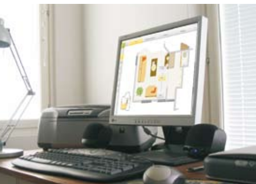
Rys. 4. Wizualizacja obiektu, w którym zaimplementowany jest Inteligentny Dom