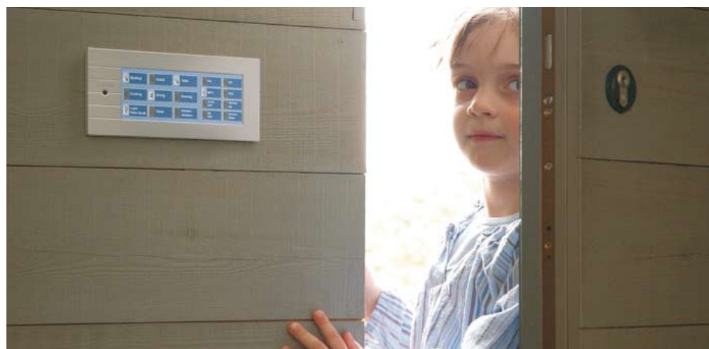
Rys. 5. Panel dotykowy

System bezprzewodowy - Teleco, proponowany do małych i średnich instalacji, które mają zapewnić wygodę i komfort użytkownika wszystkich podstawowych instalacji, oraz system magistralny - Sienna, którego elementy komunikują się między sobą po istniejących przewodach elektrycznych, zalecany przez nas do małych