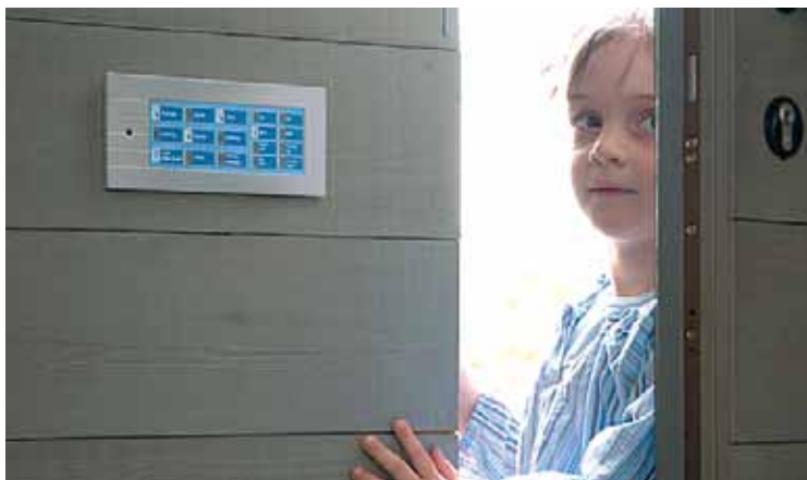
Rys. 3. Panel dotykowy

zintegrowane z układami zdalnego sterowania i pomiaru temperatury oraz ekrany dotykowe i wizualizacyjne.