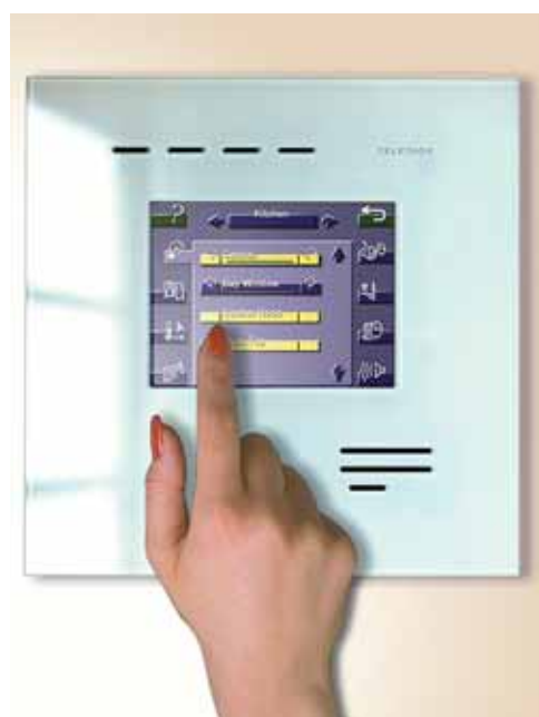
Nowoczesny i estetyczny panel LCD pozwalający sterować wszystkimi elementami w domu

Zaletą automatyki domowej Teletask jest architektura modułowa. Takie podejście sprawia, że instalację można przystosować do aktualnych możliwości finansowych każdego klienta, bez obawy o ograniczenie możliwości zmian i rozwoju. Użytkownik jest w stanie zacząć budowę z minimalną kontrolą i integracją oświetlenia oraz ogrzewania / chłodzenia. Gdy wymagania techniczne i estetyczne wzrosną, zmiana polegać będzie jedynie na wymianie interfejsów użytkownika (panele dotykowe i wizualizacyjne zawierające interfejsy przyszłości).