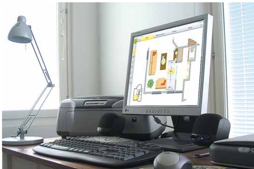
Wizualizacja obiektu, w którym zaimplementowany jest Inteligentny Dom